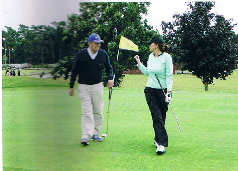
• Alla slag går att diskutera.